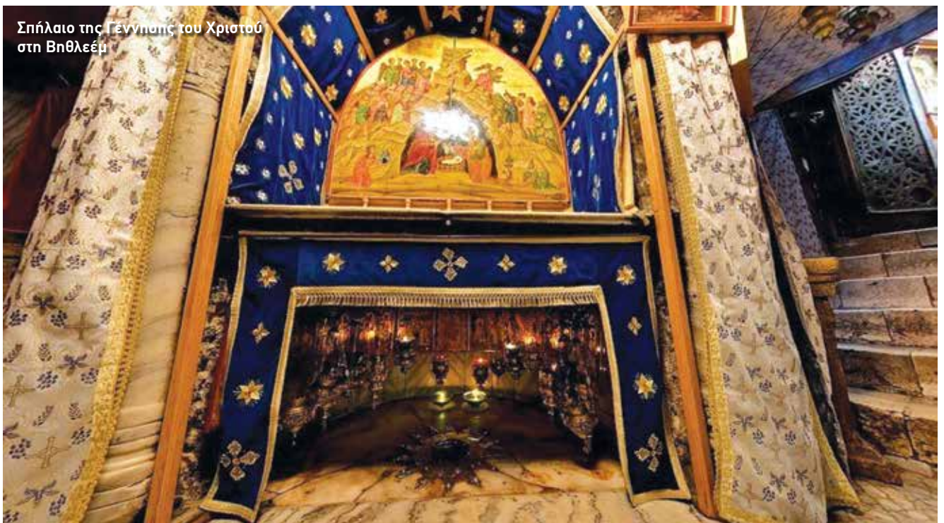
Σπήλαιο της Γέννησης του Χριστού στη Βηθλεέμ