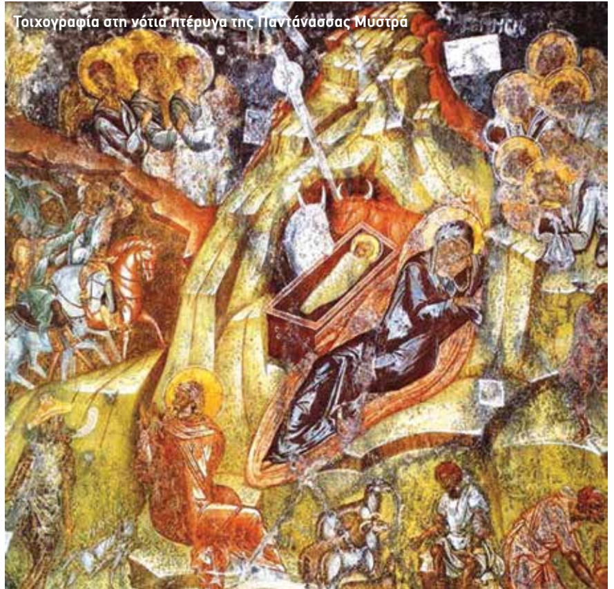
Τοιχογραφία στη νότια πτέρυγα της Παντάνασσας Μυστρά